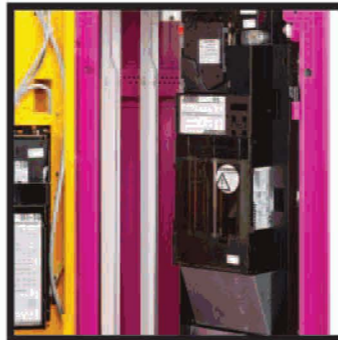
Monedero de cambio integrado canales de venta de producto físico