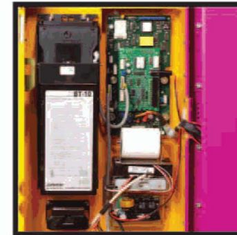
Lector de billetes de 5, 10 y 20 € e impresora de ticket